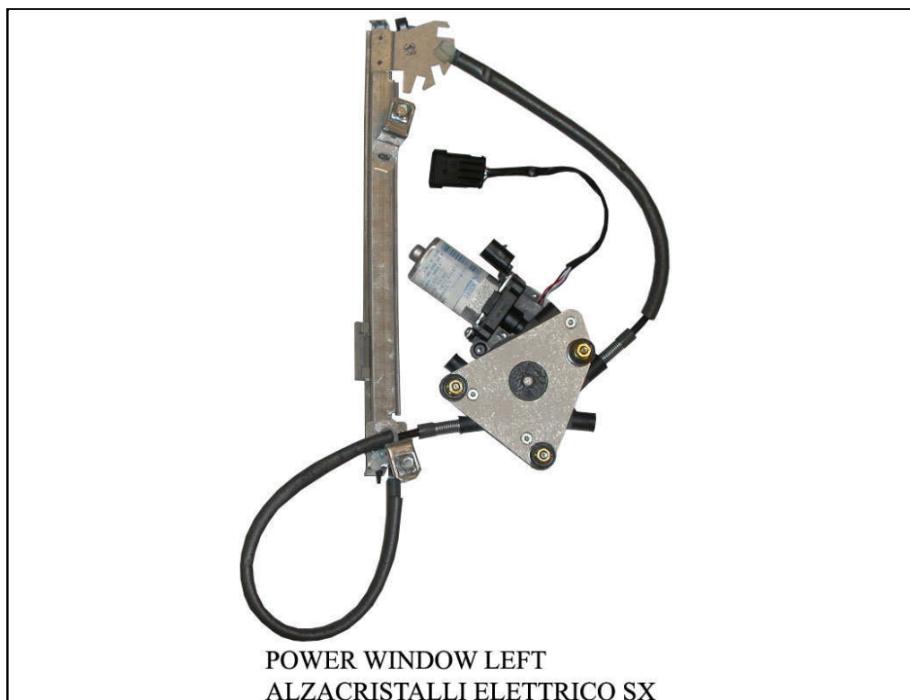
POWER WINDOW LEFT

LA PRESENTE ISTRUZIONE VALE SIA PER IL LATO SINISTRO CHE PER IL LATO DESTRO.