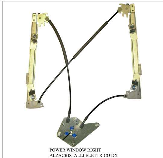
POWER WINDOW RIGHT ALZACRISTALLI ELETTRICO DX

THIS INSTALLATION INSTRUCTION IS FOR BOTH LEFT AND RIGHT SIDE. CETTE INSTRUCTION DE MONTAGE EST POUR LES DEUX COTES DROIT ET GAUCHE. DIESE MONTAGE-ANLEITUNG IST FÜR DIE BEIDE LINKE UND RECHTE SEITE. ESTA INSTRUCCION DE MONTAJE ES PARA LOS DOS LADOS IZQUIERDO Y DERECHO. ESTAS INSTRUÇÕES VALEM TANTO PARA O LADO ESQUERDO QUANTO PARA O DIREITO. DEZE AANWIJZINGEN GELDEN VOOR ZOWEL DE LINKER- ALS DE RECHTERKANT. Η ΠΑΡΟΥΣΑ ΟΔΗΓΙΑ ΑΦΟΡΑ ΤΟΣΟ ΤΗΝ ΑΡΙΣΤΕΡΗ ΟΣΟ ΚΑΙ ΤΗ ΔΕΞΙΑ ΠΛΕΥΡΑ. LA PRESENTE ISTRUZIONE VALE SIA PER IL LATO SINISTRO CHE PER IL LATO DESTRO.