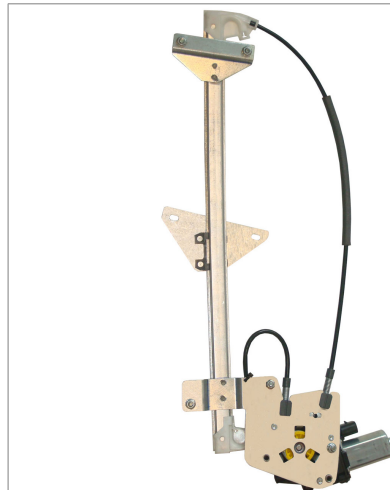
POWER WINDOW LEFT ALZACRISTALLI ELETTRICO SX

THIS INSTALLATION INSTRUCTION IS FOR BOTH LEFT AND RIGHT SIDE. CETTE INSTRUCTION DE MONTAGE EST POUR LES DEUX COTES DROIT ET GAUCHE. DIESE MONTAGE-ANLEITUNG IST FÜR DIE BEIDE LINKE UND RECHTE SEITE. ESTA INSTRUCCION DE MONTAJE ES PARA LOS DOS LADOS IZQUIERDO Y DERECHO. ESTA INSTRUÇÕES VALEM TANTO PARA O LADO ESQUERDO QUANTO PARA O DIREITO. DEZE AANWIJZINGEN GELDEN VOOR ZOWEL DE LINKER- ALS DE RECHTERKANT. Η ΠΑΡΟΥΣΑ ΟΔΗΓΙΑ ΑΦΟΡΑ ΤΟΣΟ ΤΗΝ ΑΡΙΣΤΕΡΗ ΟΣΟ ΚΑΙ ΤΗ ΔΕΞΙΑ ΠΛΕΥΡΑ. LA PRESENTE ISTRUZIONE VALE SIA PER IL LATO SINISTRO CHE PER IL LATO DESTRO.