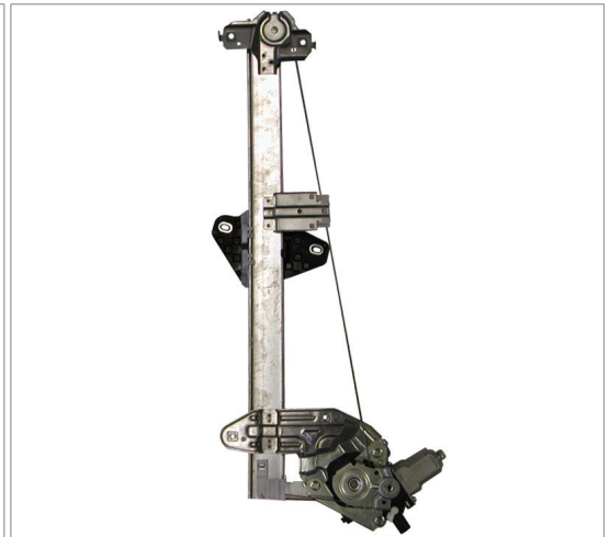
ORIGINAL POWER WINDOW LEFT ALZACRISTALLI ELETTRICO ORIGINALE SX