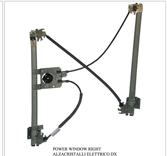
POWER WINDOW RIGHT ALZACRISTALLI ELETTRICO DX